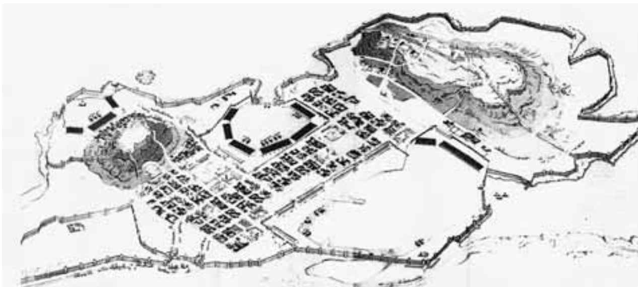
Υποθετική αναπαράσταση του Αρχαίου Πειραιά

Ως πρότυπο τους έλαβαν τις πολυάριθμες αποικίες που είχαν ιδρύσει στη Μεσόγειο και στον Εύξεινο Πόντο. Πρωτοτυπία της νέας Μιλήτου ήταν η μεγάλη ελεύθερη έκταση στο κέντρο της πόλεως η οποία προοριζετο για τις δημόσιες λειτουργίες. Έκταση προορισμένη για την Αγορά, δημόσιες Υπηρεσίες, θέατρα, Ιερά κ.λ.π. Η γη που προοριζετο για κατοικίες ήταν μοιρασμένη σε ίσα μέρη και διανεμήθηκε με κλήρωση που εξησφάλιζε την ισότητα χωρίς διακρίσεις. Υπήρχε σύστημα ορθογώνιος τεμενομένων οδών που δημιουργούν σφιχτοπλεγμένο οδικό δίκτυο. Παράλληλα υπήρχαν τρεις λεωφόροι πλάτους τριάντα μέτρων που συνέδεαν το κέντρο με τα λιμάνια, το θέατρο, τις πύλες κλπ. και που χάριζαν μεγαλοπρέπεια στην πόλη, ενώ ήσαν κατάλληλες και για πομπές, τελετές κλπ. Το σχέδιο αυτό δεν υπάρχει αμφιβολία ότι θα ήταν έργο του μεγάλου τέκνου της Μιλήτου του Ιπποδάμου πατέρα της πολεοδομίας.