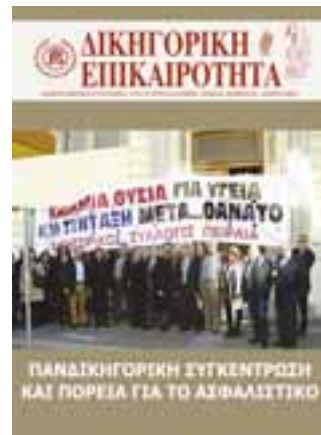
Εξώφυλλο της Δικηγορικής Επικαιρότητας αρ. τεύχους 127/Οκτ.Νοε.Δεκ. 2015 . Φωτό Δικηγόρων Πειραιά έξω από τον ΔΣΠ για την Πανδικηγορική συγκέντρωση και πορεία για το ασφαλιστικό