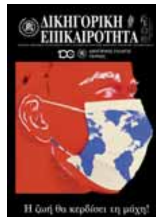
Εν μέσω Covid 19 και καραντίνας εκδόθηκε ψηφιακά το τεύχος Δικηγορικής Επικαιρότητας 144/Ιαν.Φεβ.Μαρτ. 2020