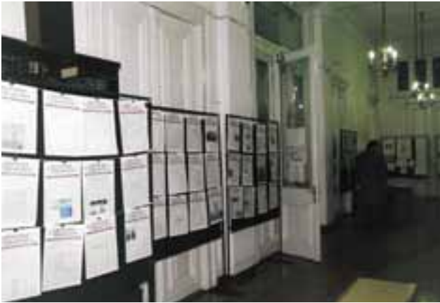
Από την εκδήλωση για τα 15 χρόνια της δικηγορικής επικαιρότητας το 2005 (τεύχη του εντύπου σε πανό) στην είσοδο (χωλ) του ΔΣΠ.