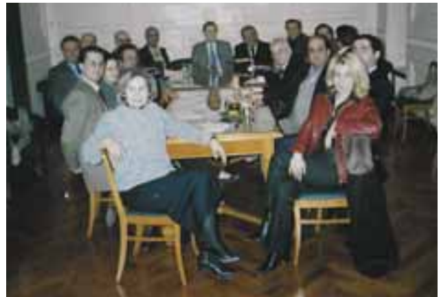
Η Συντακτική Επιτροπή συνεδριάζει το 2007