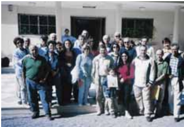
Εκδρομή της Δικηγορικής Επικαιρότητας στην Θήβα-Λειβαδιά και επίσκεψη στο Αρχαιολογικό Μουσείο Θήβας το 2001