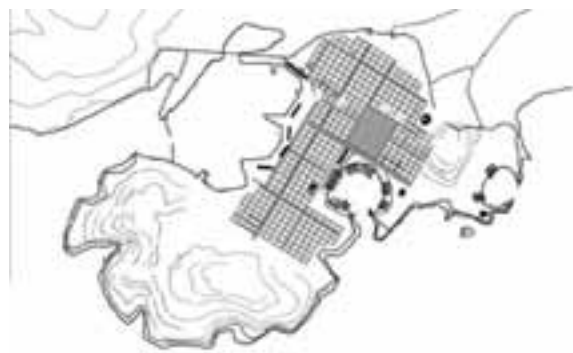
Το ρυμοτομικό σχέδιο του αρχαίου Πειραιά σύμφωνα με τις πρόσφατες ανασκαφές

Από τα δημόσια κτίρια έχουν εντοπισθεί τα δύο θέατρα, νεώσοικοι στους λιμενίσκους Ζέας και Μουνιχίας και το μεγαλύτερο κτίριο της πόλεως, η Σκευοθήκη του Φίλωνος, για τις εξαρτίσεις των τριήρων κειμένη μεταξύ 2ας Μεραρχίας και Μπουμπουλίνας δυτικά, της οδού Υψηλάντου η οποία κατά αρχαίες μαρτυρίες εκείτο πλησίον της πύλης της Αγοράς. Δυστυχώς η Ιπποδάμειος Αγορά δεν έχει εντοπισθεί αλλά θα πρέπει να ευρίσκετο στο κέντρο της πόλεως.