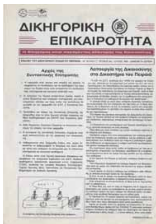
(Το 7 ο τεύχος / Ιούλιος 1993 με τις αρχές της Συντακτικής Επιτροπής)