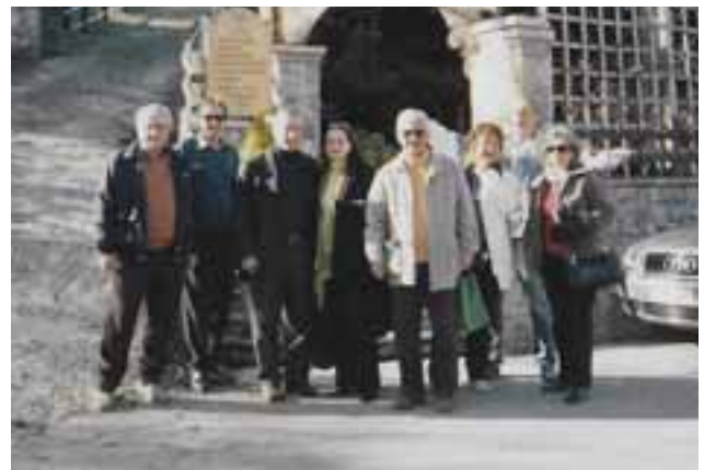
2 ήμερη εκδρομή της Δικηγορικής Επικαιρότητας στην Ορεινή Ναυπακτία